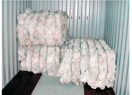
Hleðsla í gáma til útflutnings.

Allt landbúnaðarplast sem er vel flokkað fer til endurvinnslu. Plastið er að hluta endurunnið á Íslandi og að hluta flutt erlendis til endurvinnslu.